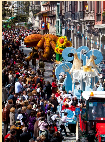
Desfile de carrozas