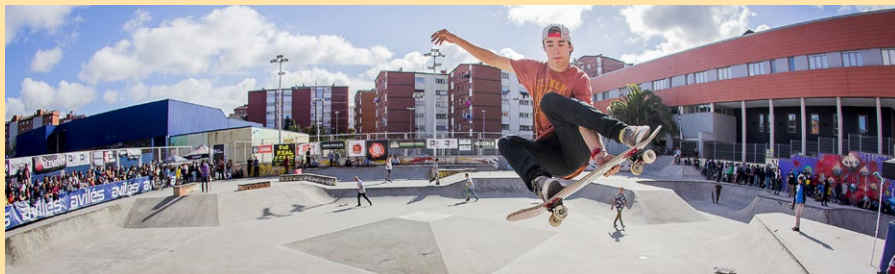
Trofeo de Skate "El Bollo"

Lugar: Skatepark Complejo Deportivo La Magdalena.