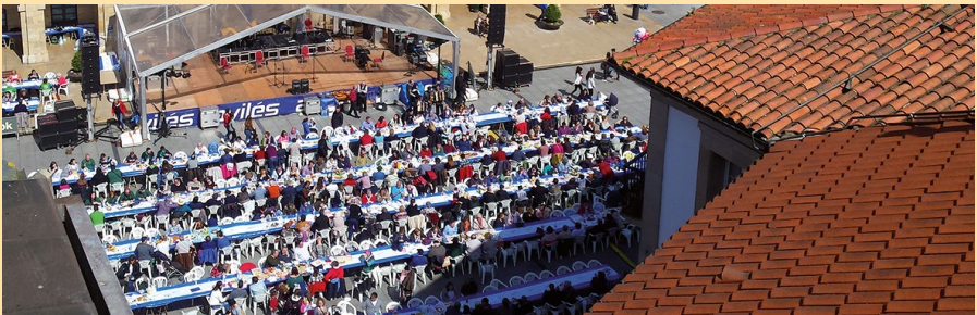
Comida en la calle

Recorrido: C/ José Cueto, Plaza de La Merced, calle y plaza de Pedro Menéndez, C/ La Muralla, C/ Dr. Graíño, C/ Fernández Balsera, C/ Severo Ochoa, finalizando en la Avda. de Cervantes.