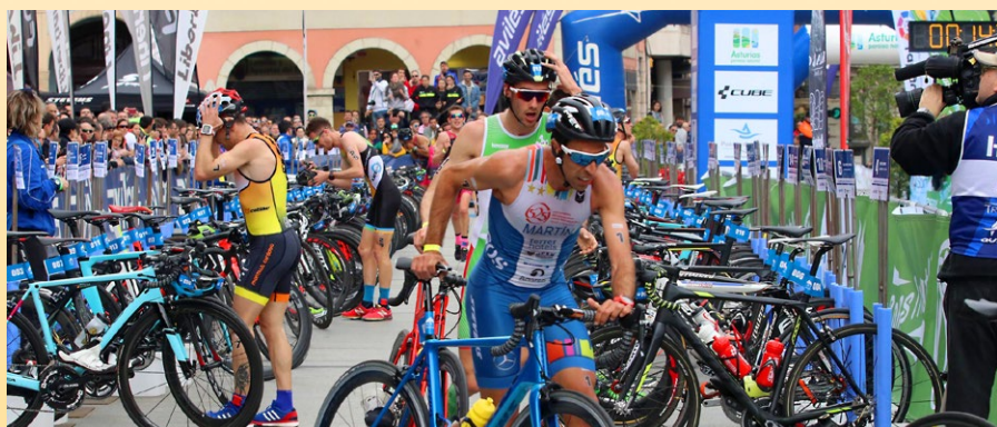
Campeonato de España de Duatlón

*Relación de Eventos Deportivos confeccionada, con los datos que obran en poder de la Fundación Deportiva Municipal de Avilés.