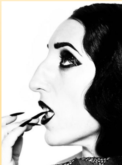
Rosy de Palma

Recorrido: C/ S. Francisco, Plaza de España, C/ La Cámara, C/ José Cueto, finalizando en la confluencia de ésta con C/ Eduardo Carreño.