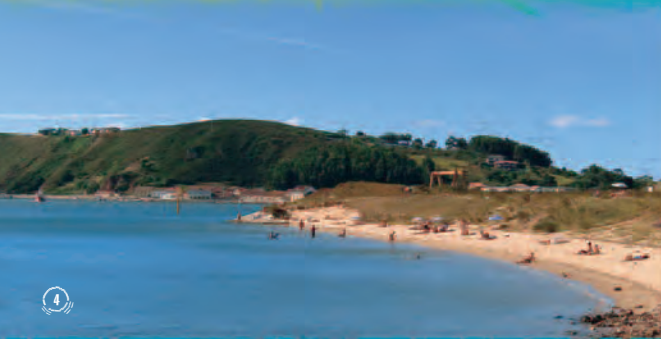
1. San Juan de Nieva. 2. Tramo del paseo en San Juan de Nieva; 3. Bocana de la ría; 4. Playa de San Balandrán; 5. Paseo a la altura de la entrada de la ría; 6. Pantalán en San Balandrán; 7. Peña del Caballo.