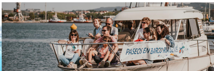
Paseos en Barco por la Ría de Avilés