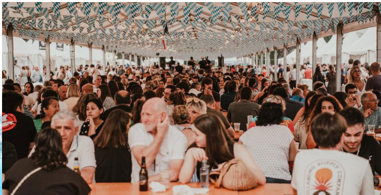
Festival de la cerveza