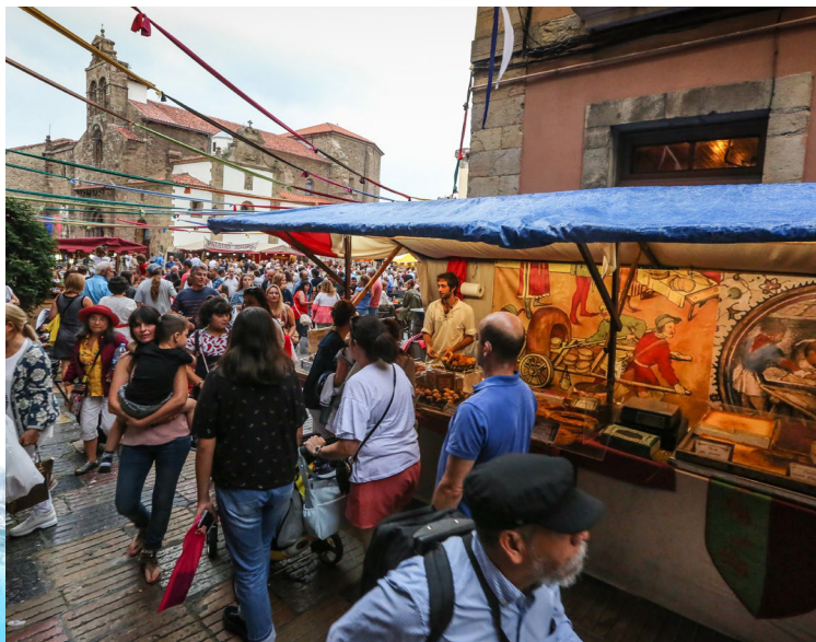
Mercado Franco de Alcabala (Mercado medieval)