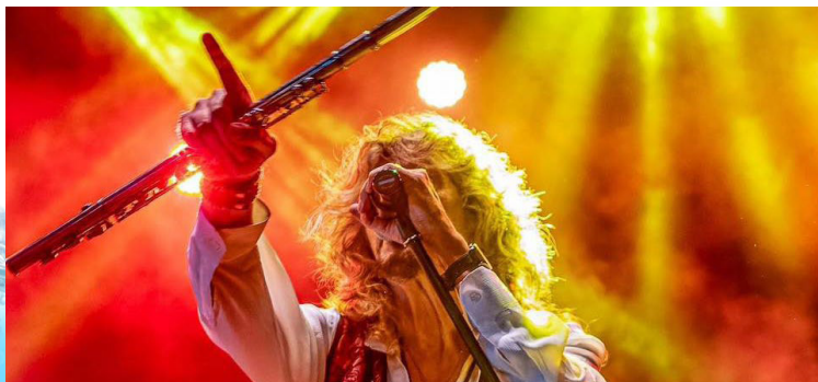
La Mar de Ruido (Ñu)