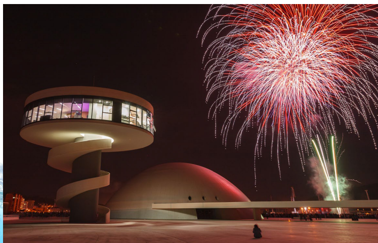
Lanzamiento de fuegos artificiales