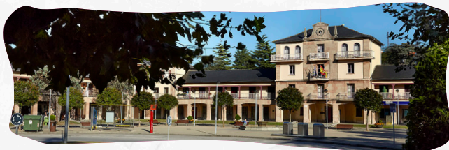
Plaza Mayor de Llaranes