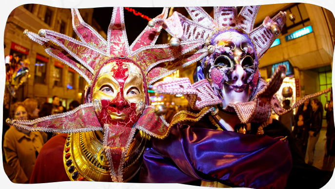
Velatorio y Entierro