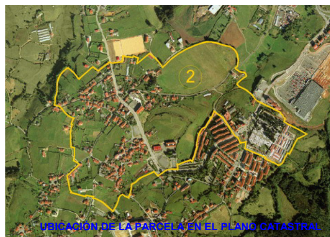
UBICACIÓN DE LA PARCELA EN EL PLANO CATASTRAL