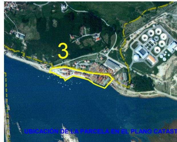
UBICACIÓN DE LA PARCELA EN EL PLANO CATASTRAL