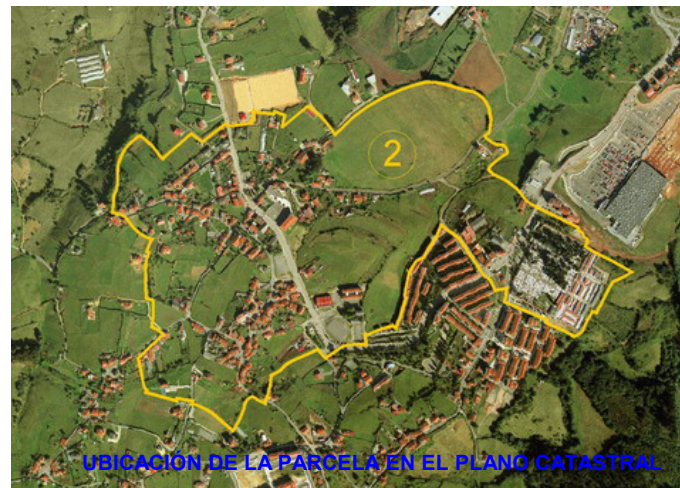
UBICACIÓN DE LA PARCELA EN EL PLANO CATASTRAL