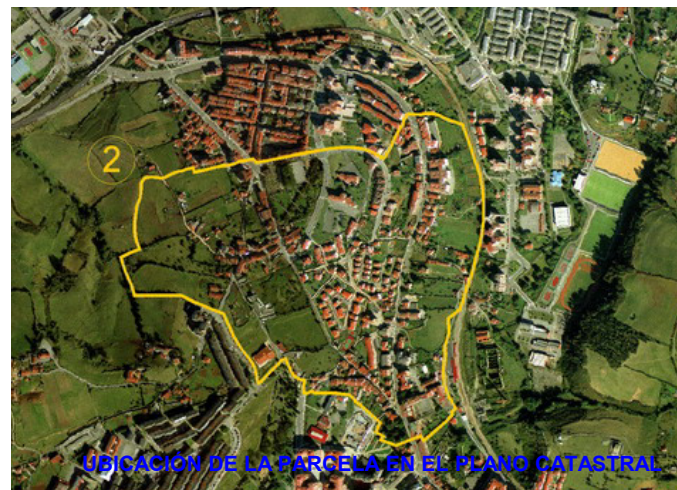
UBICACIÓN DE LA PARCELA EN EL PLANO CATASTRAL