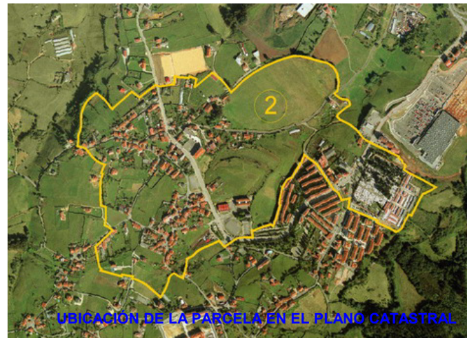
UBICACIÓN DE LA PARCELA EN EL PLANO CATASTRAL