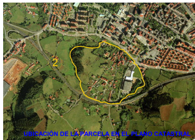
UBICACIÓN DE LA PARCELA EN EL PLANO CATASTRAL