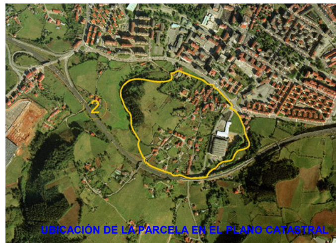
UBICACIÓN DE LA PARCELA EN EL PLANO CATASTRAL