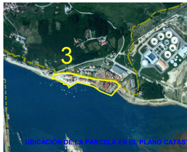
UBICACIÓN DE LA PARCELA EN EL PLANO CATASTRAL