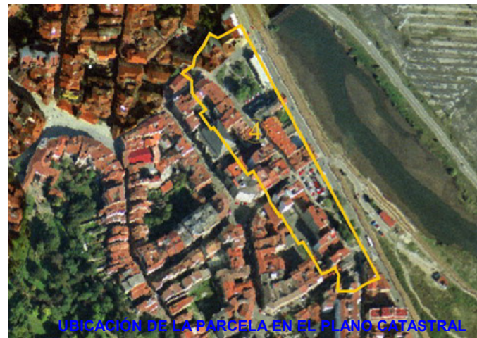
UBICACIÓN DE LA PARCELA EN EL PLANO CATASTRAL