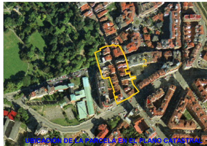
UBICACIÓN DE LA PARCELA EN EL PLANO CATASTRAL