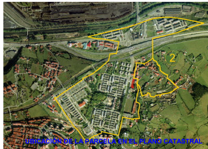
UBICACIÓN DE LA PARCELA EN EL PLANO CATASTRAL