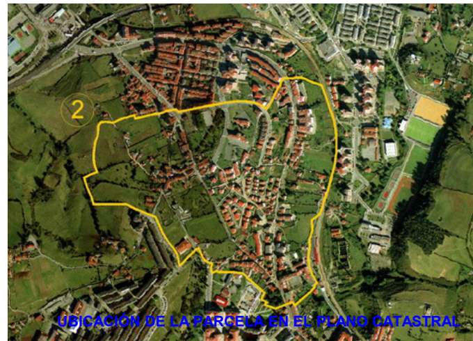
UBICACIÓN DE LA PARCELA EN EL PLANO CATASTRAL