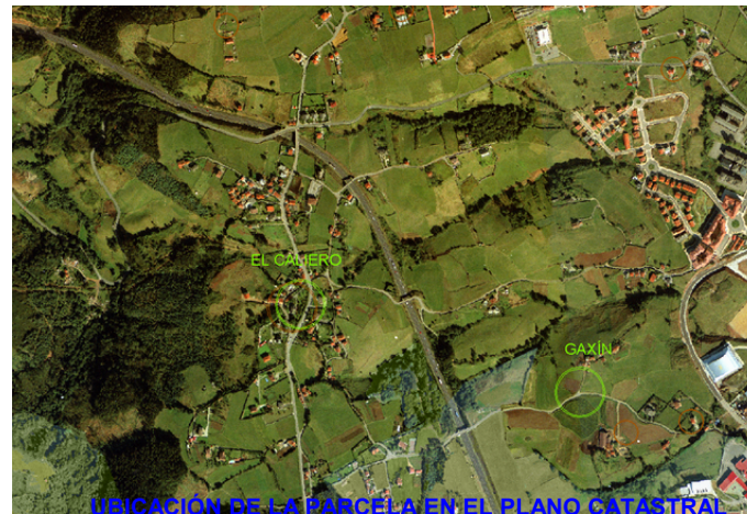
UBICACIÓN DE LA PARCELA EN EL PLANO CATASTRAL