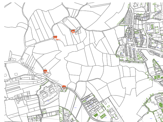
USO / APROVECHAMIENTO ACTUAL PLANTAS EDIFICACION