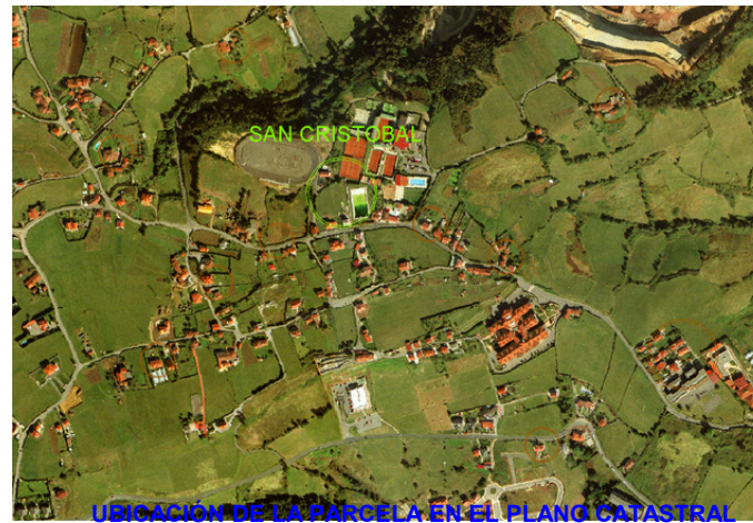
UBICACIÓN DE LA PARCELA EN EL PLANO CATASTRAL