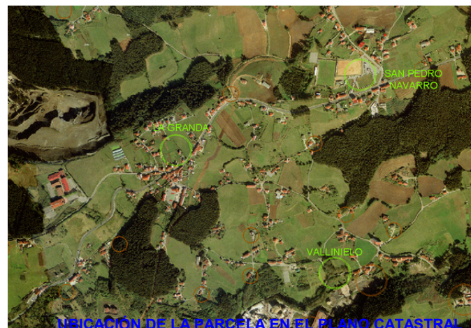
UBICACIÓN DE LA PARCELA EN EL PLANO CATASTRAL