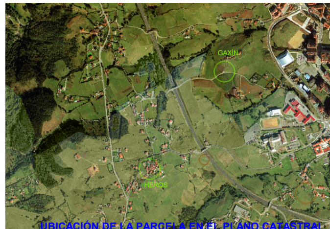
UBICACIÓN DE LA PARCELA EN EL PLANO CATASTRAL