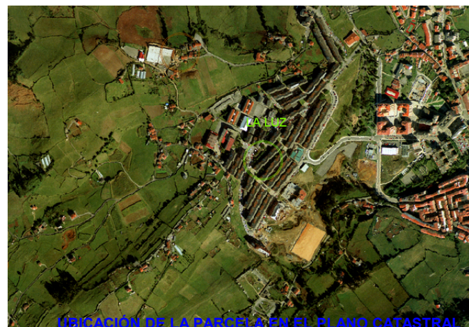
UBICACIÓN DE LA PARCELA EN EL PLANO CATASTRAL