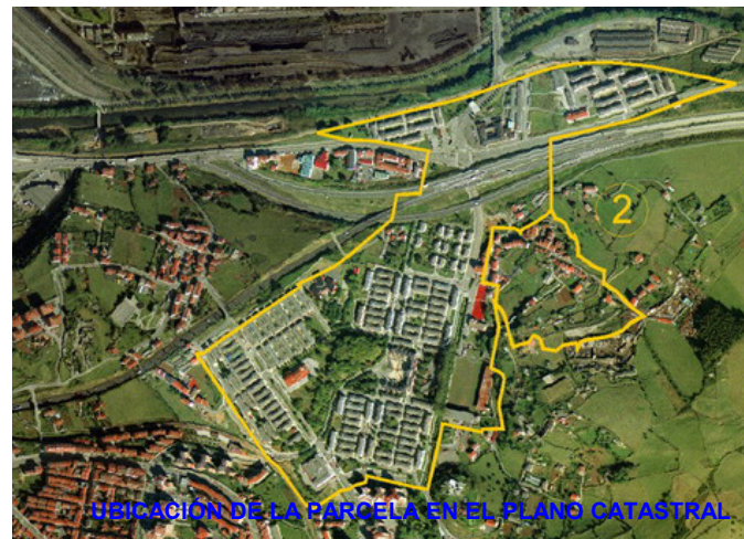
UBICACIÓN DE LA PARCELA EN EL PLANO CATASTRAL